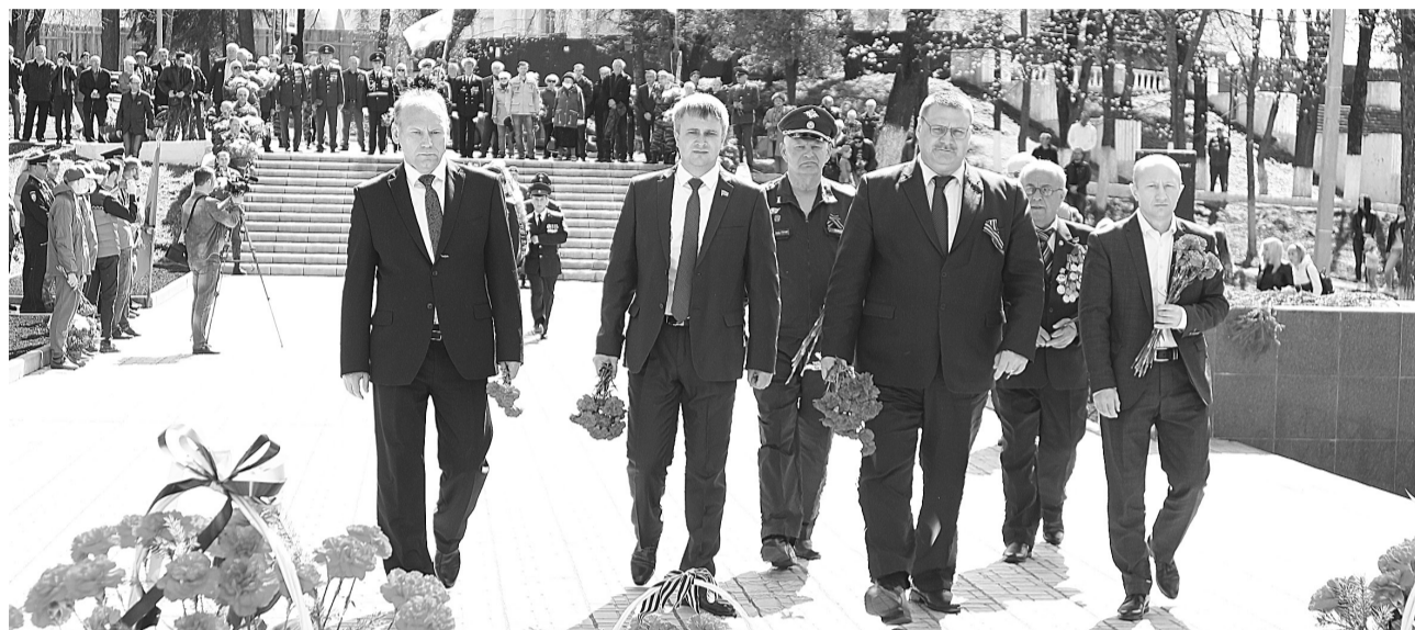
Возложение цветов к Вечному огню