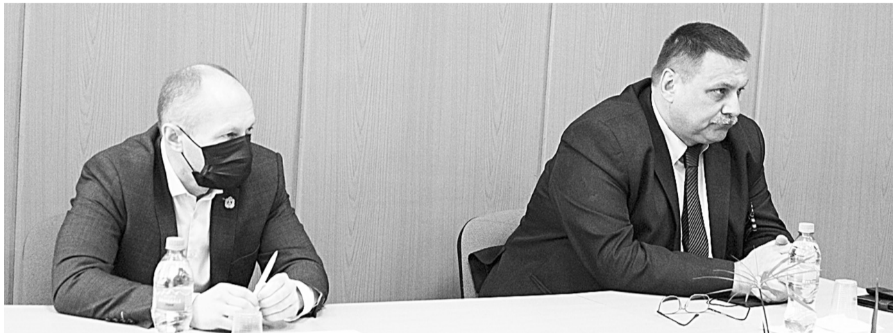
Заместитель председателя правительства Новгородской области Евгений Богданов и глава района Игорь Швагирев отвечают на вопросы предпринимателей

Представители малого бизнеса и микробизнеса, самозанятые города и района 9 мая встретились с заместителем председателя правительства Евгением БОГДАНОВЫМ.