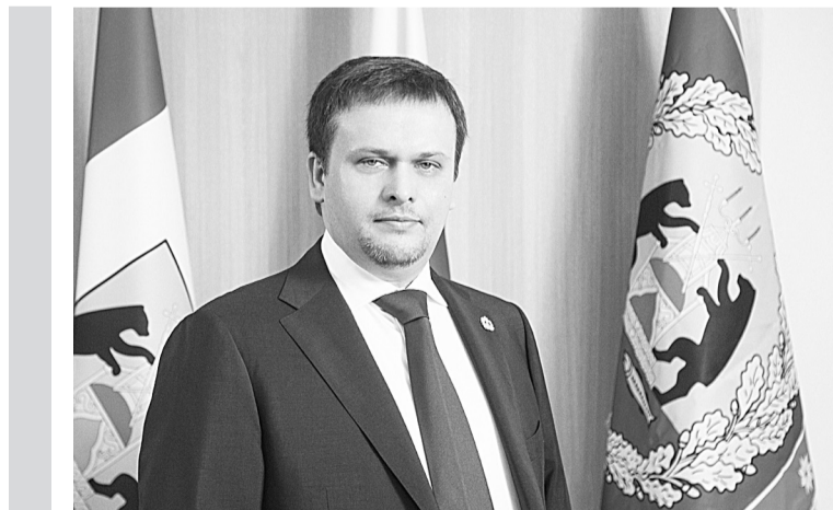
Глава региона Андрей НИКИТИН:

В общей сложности поддержку получат 27 млн. российских детей, от младенцев до учеников. «Считаю, что именно такими должны быть приоритеты государства. Особенно сейчас, когда в первую очередь должны заботиться о безопасности людей пожилого возраста и поддерживать семьи с детьми», — пояснил Путин.