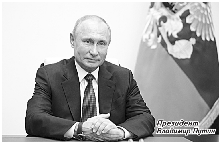
Президент Владимир Путин

рублей за двухнедельную смену получат врачи социальных учреждений с 15 апреля по 15 июля.