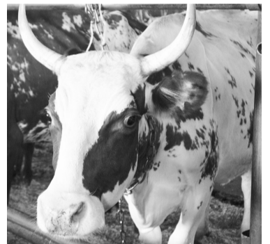
Бурёнки айширской породы отличаются высокими надоями